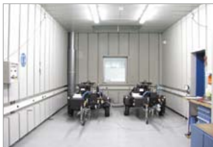
Compresores Mobilair en la sala de pruebas

La fábrica de compresores móviles de la central de KAESER en Coburg (Alemania)