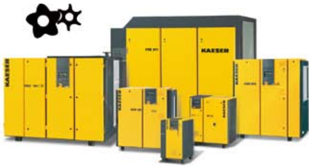
Compresores de tornillo con PERFIL SIGMA