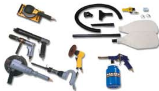
Accesorios / herramientas neumáticas