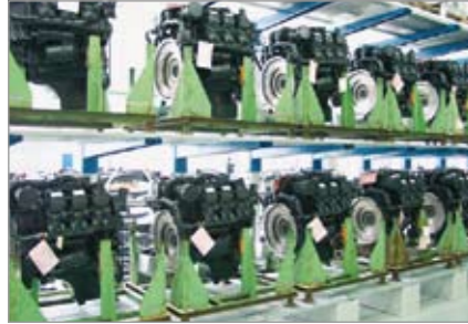
Motores de accionamiento en una estantería del almacén esperando el momento de su montaje