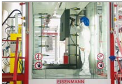
El recubrimiento con pintura sinterizada proporciona a las máquinas una protección duradera