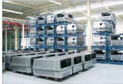
Departamento de fabricación de carrocerías para los compresores móviles