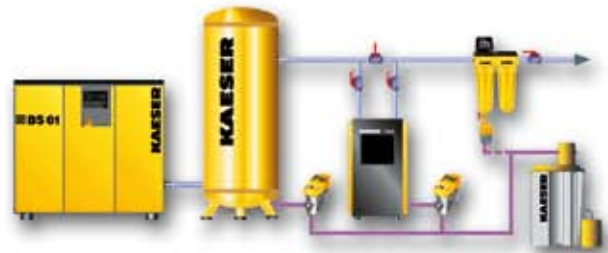
Tratamiento de aire comprimido (filtros, tratamiento de condensados, secadores de adsorción, secadores de carbón activo)