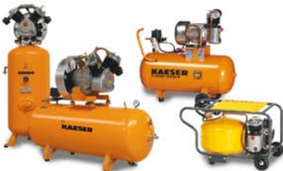
Compresores de pistón para talleres