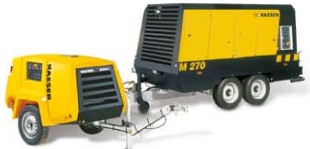
Compresores móviles para obras con PERFIL SIGMA