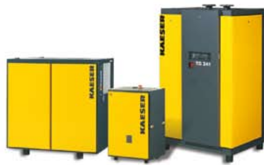
Secadores frigoríficos de alto rendimiento con regulación SECOTEC