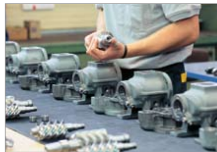
Montaje de los bloques