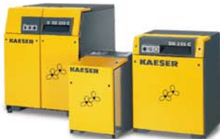
Soplantes a baja presión con PERFIL OMEGA